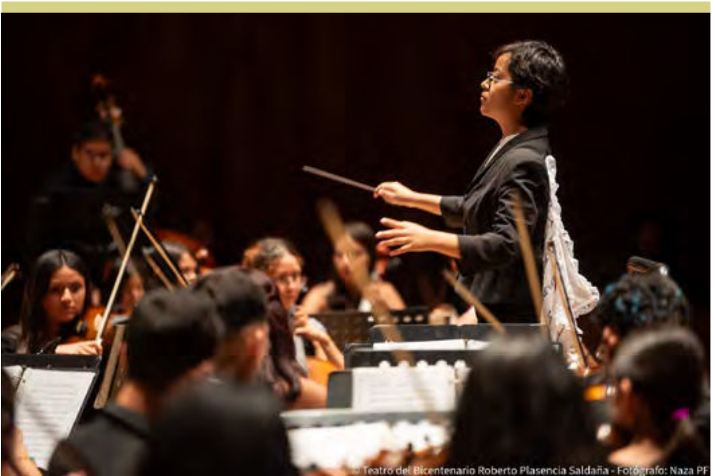
Teatro del Bicentenario Roberto Plasencia Saldaña